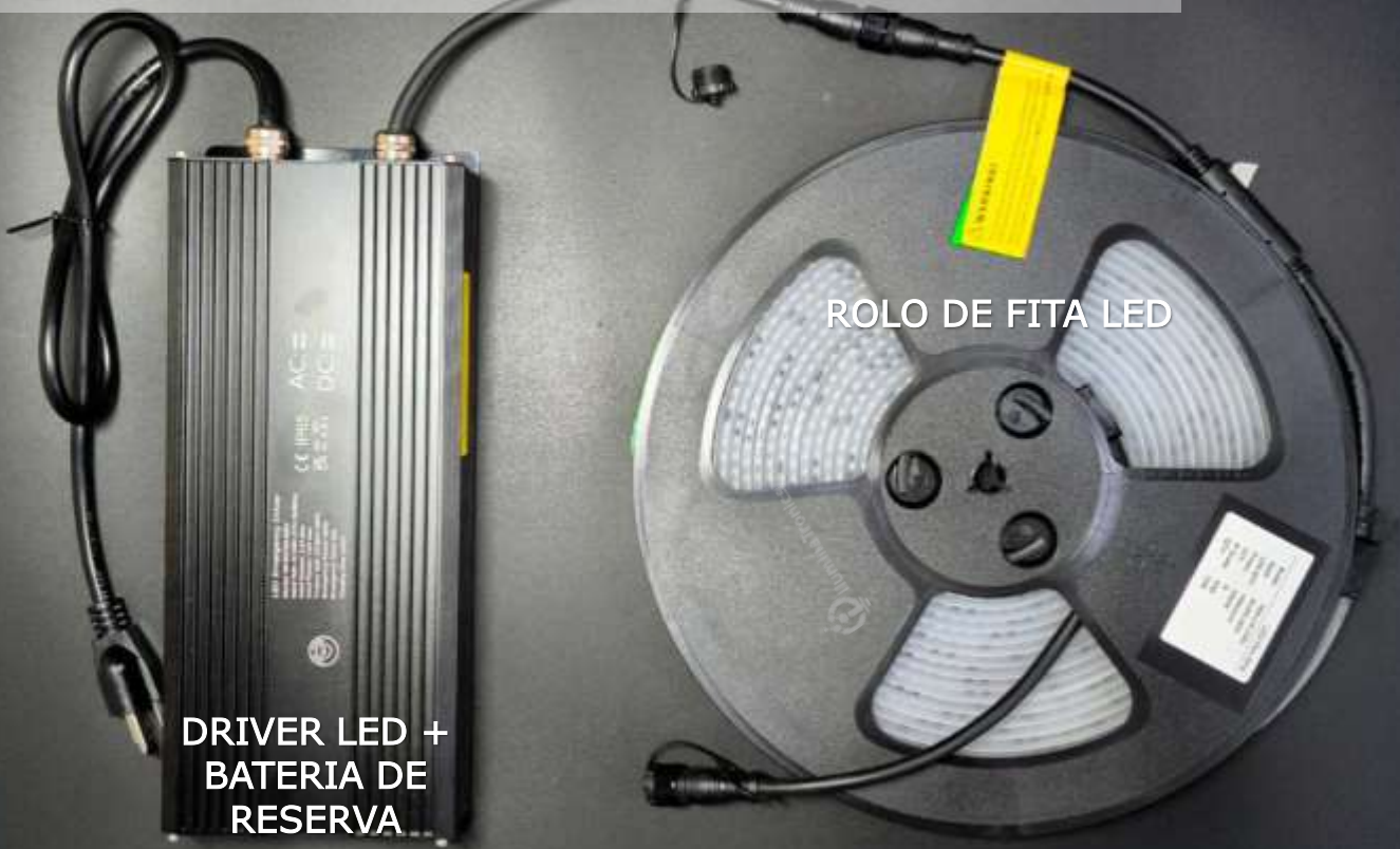
DRIVER LED + BATERIA DE RESERVA