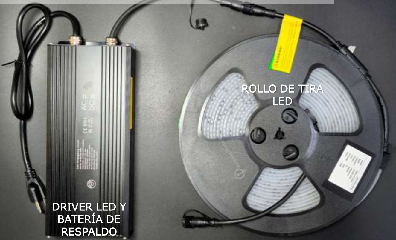
DRIVER LED Y BATERÍA DE RESPALDO